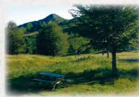
Aittolako atseden lekua. Zona recreativa de Aittola.

Más adelante, nos incorporaremos a la pista que se dirige a la antena de Erlo y, tras avanzar unos metros más, a la derecha, seguiremos el cartel que señala el acceso a Xoxote. Dejaremos atrás varias bordas de pastores y, tras subir una pendiente pronunciada, llegaremos al refugio de Xoxote.