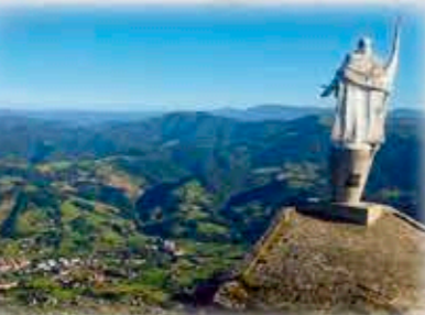
San Inazioaren irudia baitara zaitzen Xoxote gainean. Imagen de San Ignacio custodiando el valle desde la cima de Xoxote.

Azketatik tontorrera. Azketako malda gogorretatik elur zuilora joango gara. Haren ondotik pasatu eta Xoxoteko tontorrerako bidezidorra hartuko dugu, ezkerrekoa. Gaiñean San Inazioaren estatua eta Xoxoteko aterpea daude.