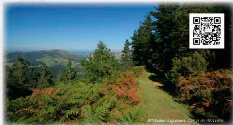
Aitzbakar inguruan, Gorra de Aitzbakar.

La vuelta al Izarraitz consiste en un recorrido circular balizado y homologado, que rodea a media altura la ladera del sistema montañoso. Lo conforman el conjunto de tres PRs: el PR Gi-139 Azpeitia-Azkoitia, el PR Gi-137 Azkoitia-Zestoa y el PR Gi-138 Zestoa-Azpeitia. Se encuentra señalizada mediante líneas amarillas y flechas o señales verticales.