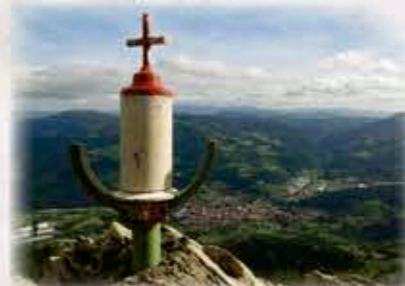
Kakuteko gaina. Cumbre de Kakute.

Kakute seinalea ikusi arte, ezkerrean joango gara gurutze aldera.