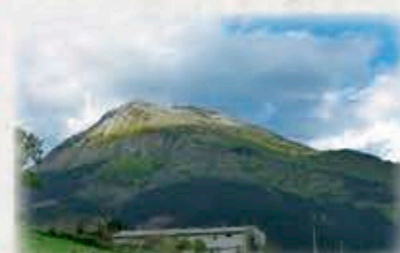
Erloko bista Zestoetik. Vista de Erlo desde Zestoa.

Por el pozo y la borda de Intziola. Continuaremos por la pista de manera ascendente y llegaremos al pozo de Intziola y, más adelante, a la borda de Intziola. Desde la borda de Intziola, avanzaremos entre piedras hacia arriba y, más adelante, tras discurrir por la calzada, llegaremos a la antena. Seguiremos por la pista y, más adelante, cogemos a la derecha. Saldremos a una zona de prados, desde donde acometeremos la última subida, antes de llegar a Erlo.