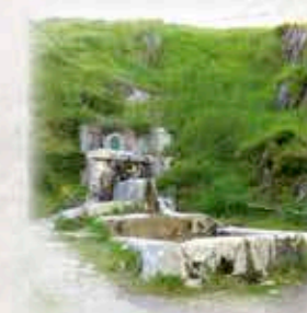
Azketa iturria, Azpeitia-Xoxote igoeran. Fuente de Azketa, en la ascensión Azpeitia-Xoxote.