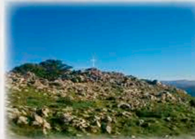
Erlo gaina. Cumbre de Erlo.

Intziolako potzura iritsiko gara, ondoren Intziolako bordara. Bordatik harri artean gora hasiko gara eta aurrerago kaltetan zehar joango gara antenara iritsi arte. Pistari segi eta aurrerago eskubira hartu. Zelaletara irtingo gara eta azken aldapa igoko dugu Erlora iristeko.