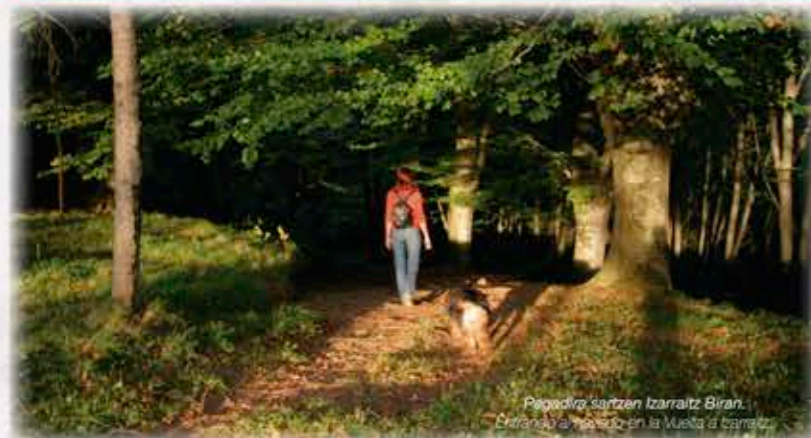
Popadira santzen Izarraitz Bira. Eretoa en la Vuelta a Izarraitz.

Izarraitzeko bira (IB), mendikateari magal erdiko altueran bira ematen dion ibilbide zirkular balizatu eta homologatua da, hiru PR-ren baturak osatzen duena; PR Gi-139 Azpeitia-Azkoitia, PR Gi-137 Azkoitia-Zestoa, eta PR Gi-138 Zestoa-Azpeitia. Marka txuri horiz eta gezi nahiz seinale bertikalez bideratua dago.