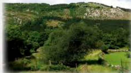
Kakuteko bidean Aitza baserri ingurunea, goranzko aldapa zorbobail gogortzen den lekua. Inmediaciones del caserío Aitza en la ascensión Azkoitia-Kakute, desde donde la subida comienza a ser un poco más dura.

Bidean eskubira. Maldan gora goazela, eskubira hartu behar dugu aurkitzen dugun bidegurutzean eta Kakuteko gurutzea geure aurre eta gainean ikusiko dugu. Segi bideari