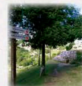
Izkitturri iturria, Aittola-Xoxote igoeran eta Kakute mendiko behean geratzen da. Fuente de Izkitturri, en la ascensión de Aittola-Xoxote y queda abajo del monte Kakute.